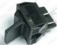
TQ8000 pulse switch выключатель пульс-режима