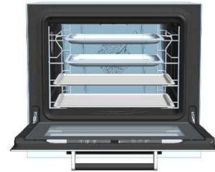
Противни SMEG и GN 2/3