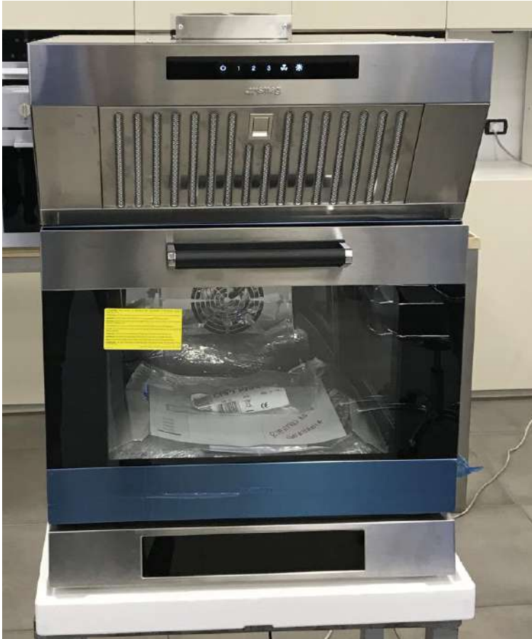
Сенсорный дисплей с белой светодиодной подсветкой