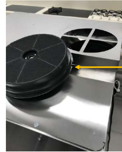
Система с карбоновым фильтром